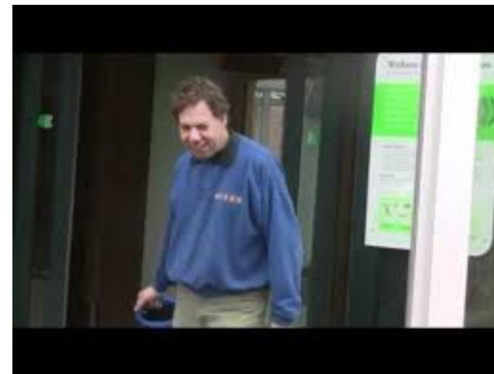
Cordaan en Artis werken 18 jaar samen