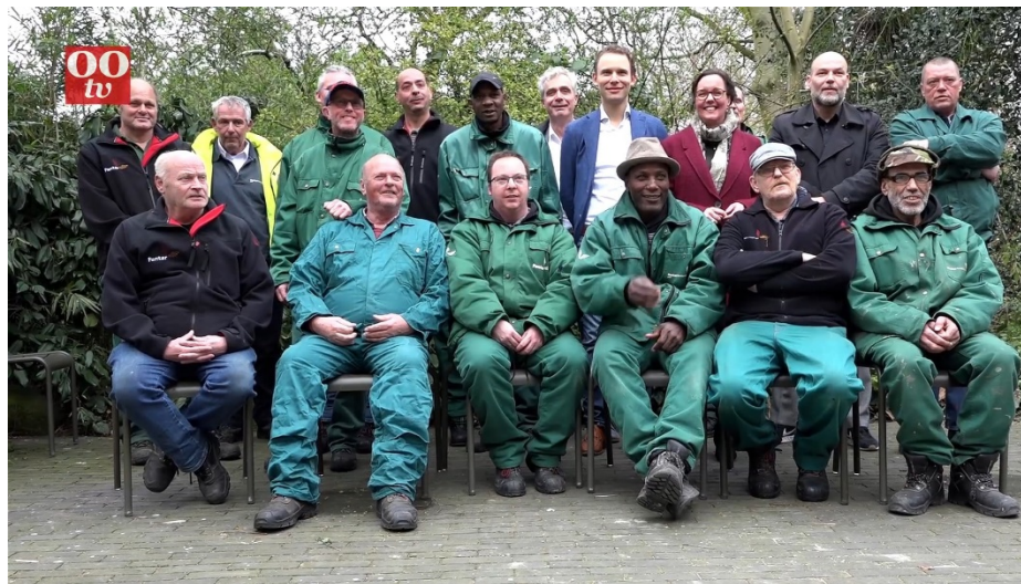
Pantar en Artis werken 40 jaar samen